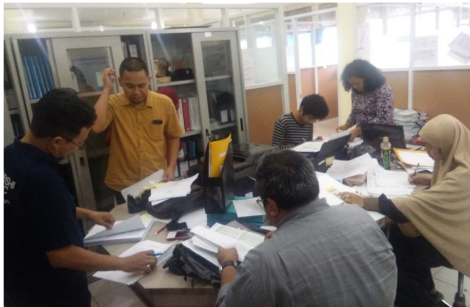
Gambar. Koordinasi kelengkapan data dan dokumen bukti fisik

mahasiswa, SOP, data mahasiswa, data lulusan dan IPK, bukti prestasi mahasiswa, data survey alumni/lulusan dan pengguna, data diri dosen, data kepangkatan dosen, kegiatan dosen, prestasi dan keanggotaan dosen, dokumen kurikulum, silabus, RPS, absensi dan monitoring pembelajaran, data penelitian, data PKM, data sarana dan prasarana, laporan penelitian, laporan PKM, serta bukti draft kerjasama Prodi baik dengan instansi dalam maupun luar negeri.