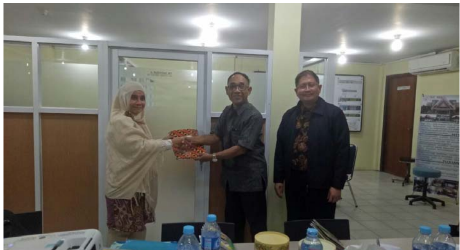
Gambar. Serah terima berita acara visitasi ke Prodi