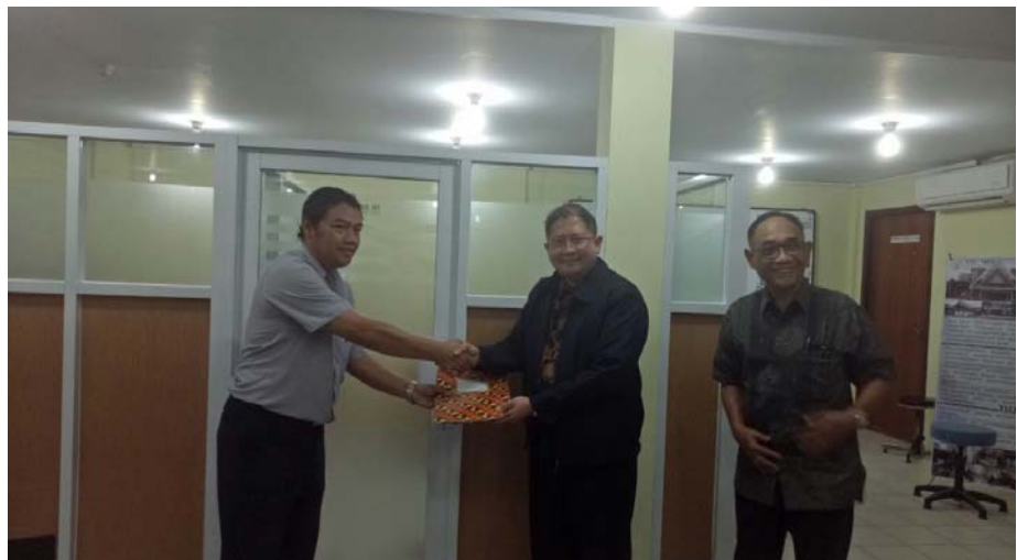
Gambar. Serah terima berita acara visitasi ke Fakultas