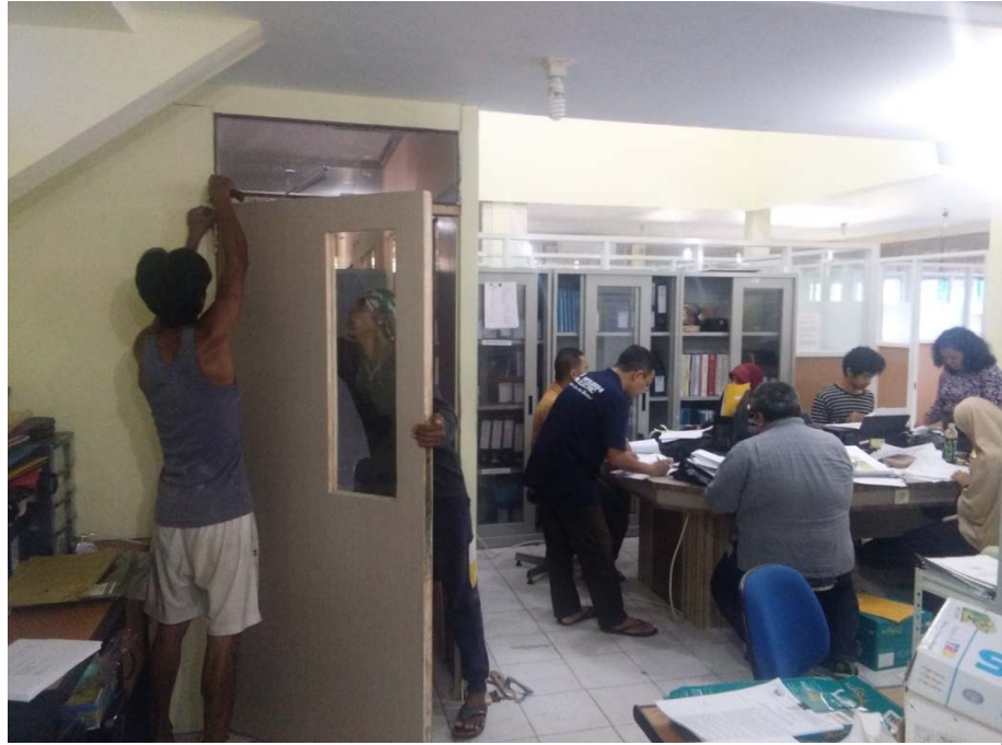
Gambar. Perbaikan pintu loby ruang dosen

Penataan dan pembenahan fasilitas fisik dilakukan dengan pembersihan ruangan dan lingkungan sekitar Prodi, pengaturan layout perabot ruang (meja, kursi, lemari), pemasangan wallpaper, pengecatan, dan pemasangan poster atau banner, serta gelar karya atau produk mahasiswa pada ruangan studio dan laboratorium.