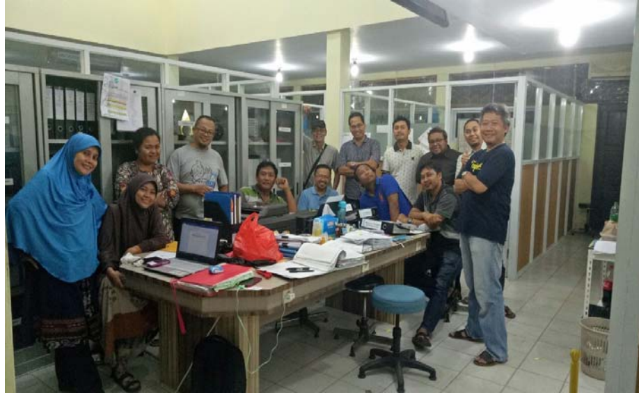
Gambar. Tim Akreditasi dan Dosen Prodi Arsitektur

Setelah semua kegiatan selesai Tim Akreditasi Prodi melakukan koordinasi dan evaluasi keseluruhan hasil kegiatan dan membagi tugas untuk menyusun laporan kegiatan visitasi dan laporan penggunaan keuangan untuk diserahkan ke Fakultas.