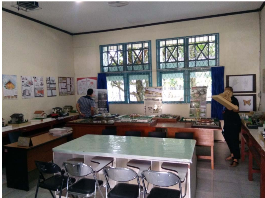
Gambar. Pembenahan ruang laboratorium perancangan

Penataan dan pembenahan fasilitas fisik dilakukan dengan pembersihan ruangan dan lingkungan sekitar Prodi, pengaturan layout perabot ruang (meja, kursi, lemari), pemasangan wallpaper, pengecatan, dan pemasangan poster atau banner, serta gelar karya atau produk mahasiswa pada ruangan studio dan laboratorium.