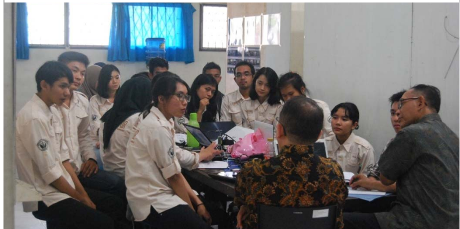
Gambar. Diskusi dan wawancara oleh perwakilan mahasiswa