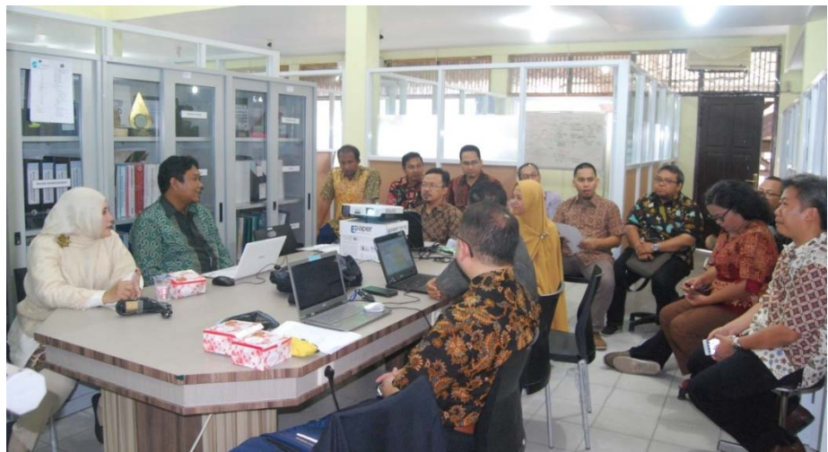
Gambar . Pembahasan borang F4 berlangsung di ruang Prodi Arsitektur dan dihadiri oleh semua Dosen Prodi