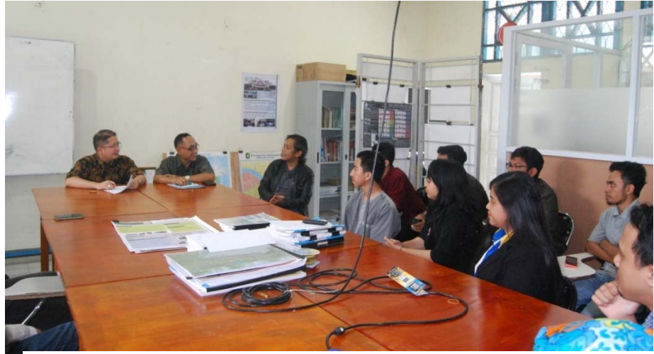
Gambar. Wawancara dan diskusi dengan perwakilan alumni dan pengguna (user)