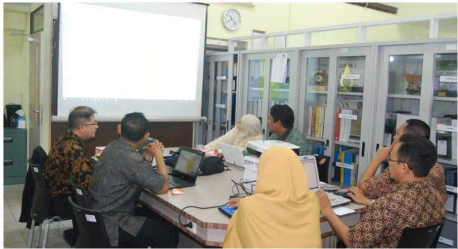
Gambar. Pemaparan dan pembahasan borang F4 oleh Ketua Prodi dan Tim Akreditasi Prodi