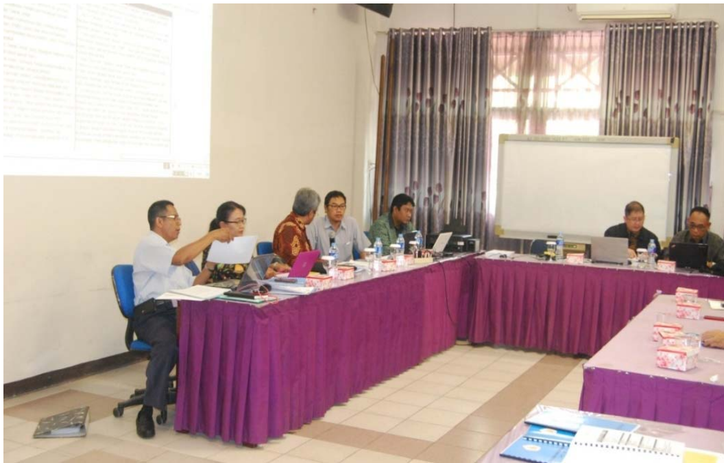
Gambar. Pembahasan borang di ruang sidang 1 Fakultas Teknik