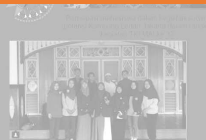
Studi Lapangan Prinsip Sifat dan Sifatnya