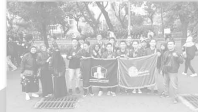
Partisipasi Himpunan Mahasiswa Arsitektur dalam kegiatan Temu Karya Ilmiah Mahasiswa Arsitektur Indonesia (TKI MAI) ke 33 di Jakarta