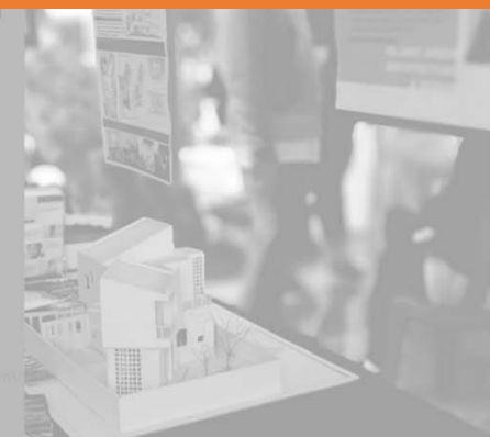
Formasi Model Kerja Mahasiswa