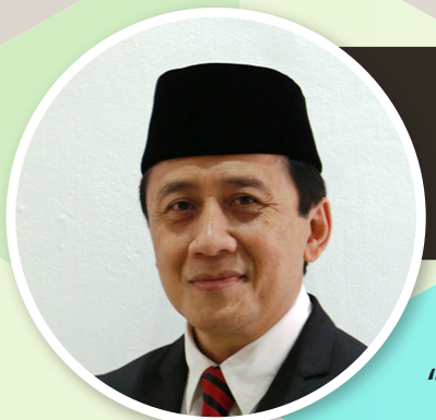
Triawan Munaf (Kepala Badan Ekonomi Kreatif)

"Potensi Kerjasama Pemerintah dan Swasta dalam Pengembangan Kawasan Perbatasan Negara Berbasis Jejaring Infrastruktur"